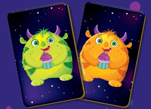
вид и сладость