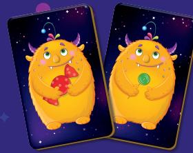
вид и цвет