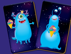
цвет и сладость